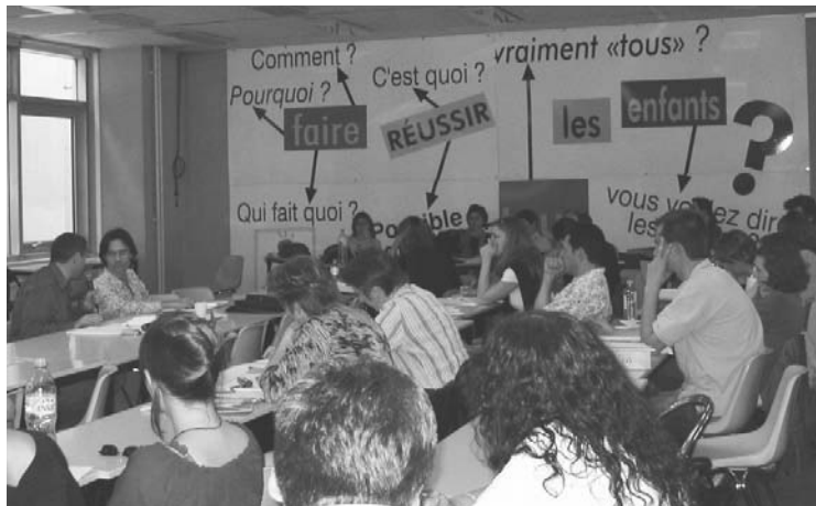
Le SNUipp organise régulièrement des rencontres avec les AVS, dans les départements ou nationalement.

Le SNUipp se prononce pour un plan de professionnalisation des AVS. Ce plan doit permettre d'ouvrir des discussions avec l'ensemble des partenaires pour aboutir.