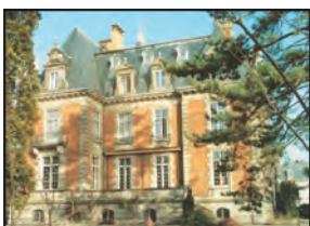
Réalisé par la DSDEN du Haut-Rhin